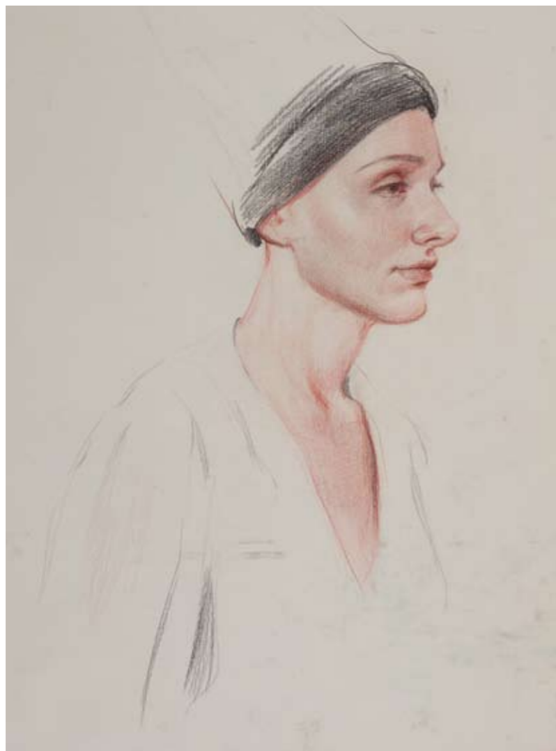
◀ А. Р. Давлашян. Девушка из средневековья. 2019 г. Бумага, цветные карандаши. 93 x 58 см