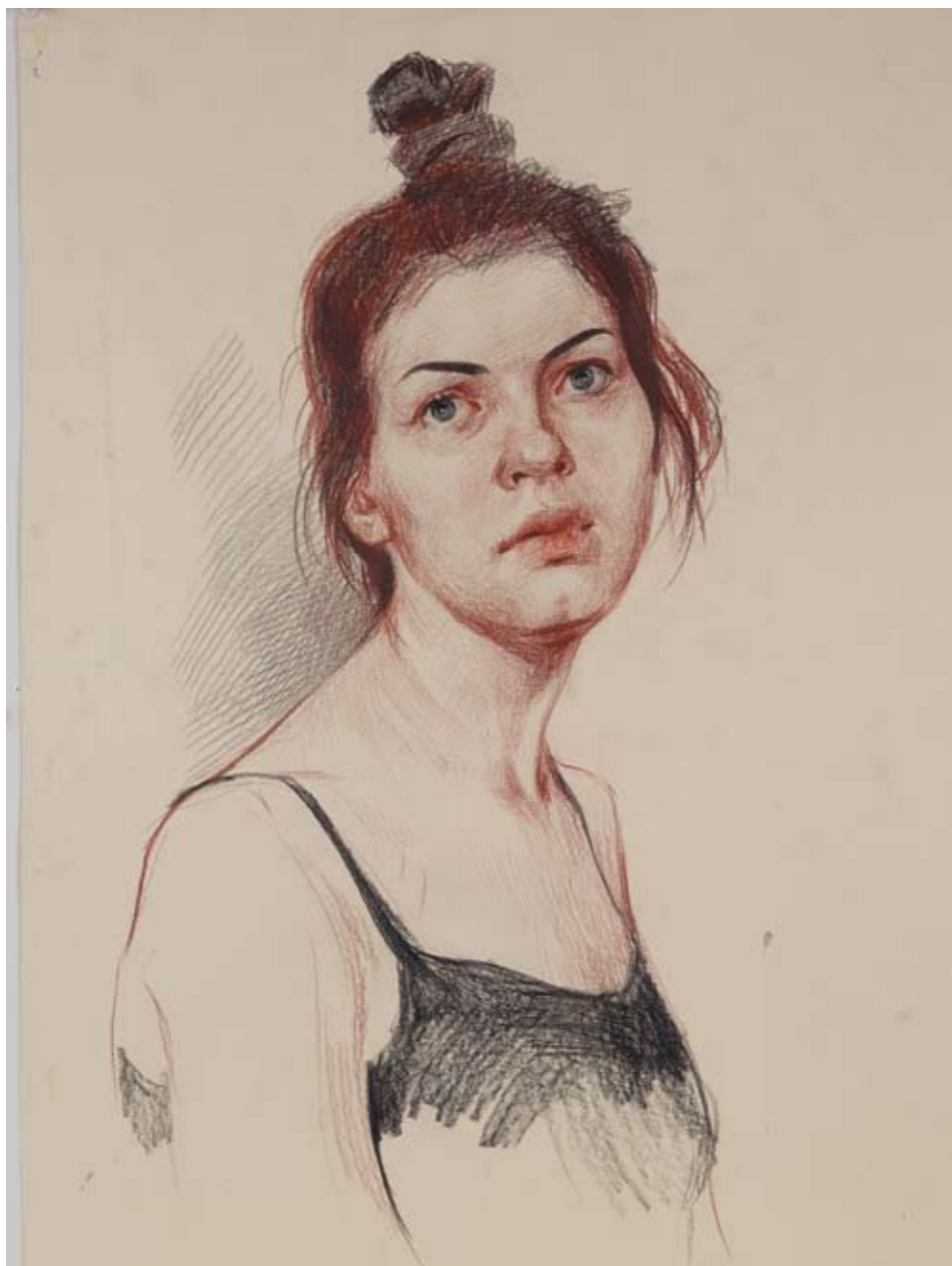
◀ А. Р. Давлашян. В думах. 2016 г. Бумага, пастель. 64 x 50 см