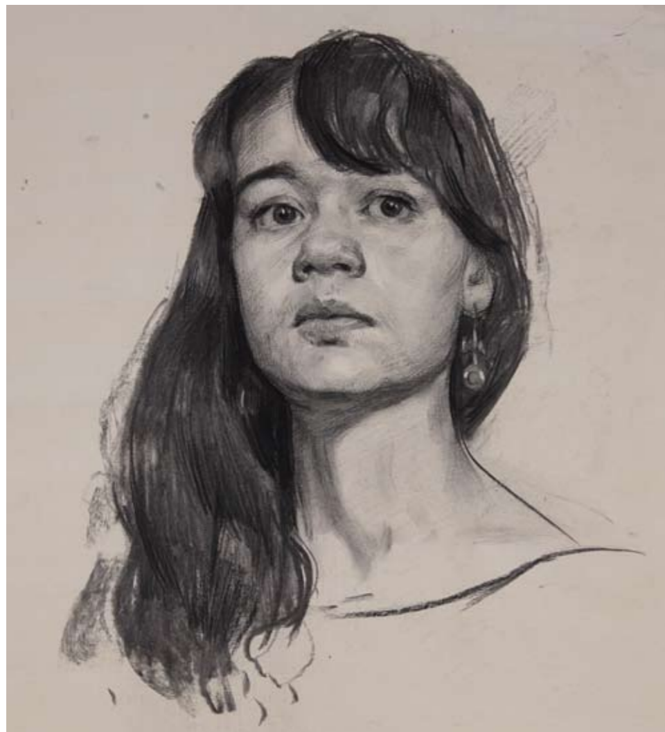
◀ А. Р. Давлашян. Даша. 2015 г. Бумага, рисовальный уголь, угольный карандаш. 55 x 40 см