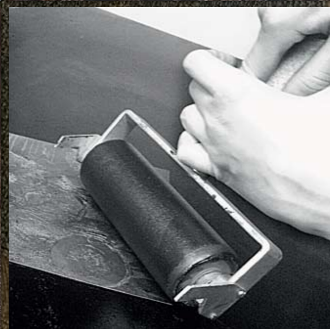
ОФОРТ: ЕЛЕНА ЯКОВЛЕВА (ГРАЖДЕВСКАЯ); ФОТО: АНАСТАСИЯ СМИРНОВА.