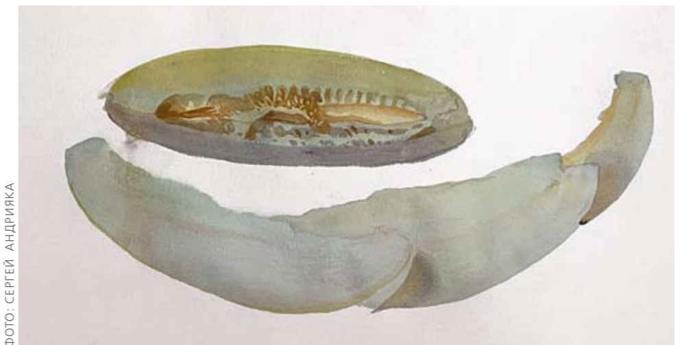
ФОТО: СЕРГЕЙ АНДРИЯКА