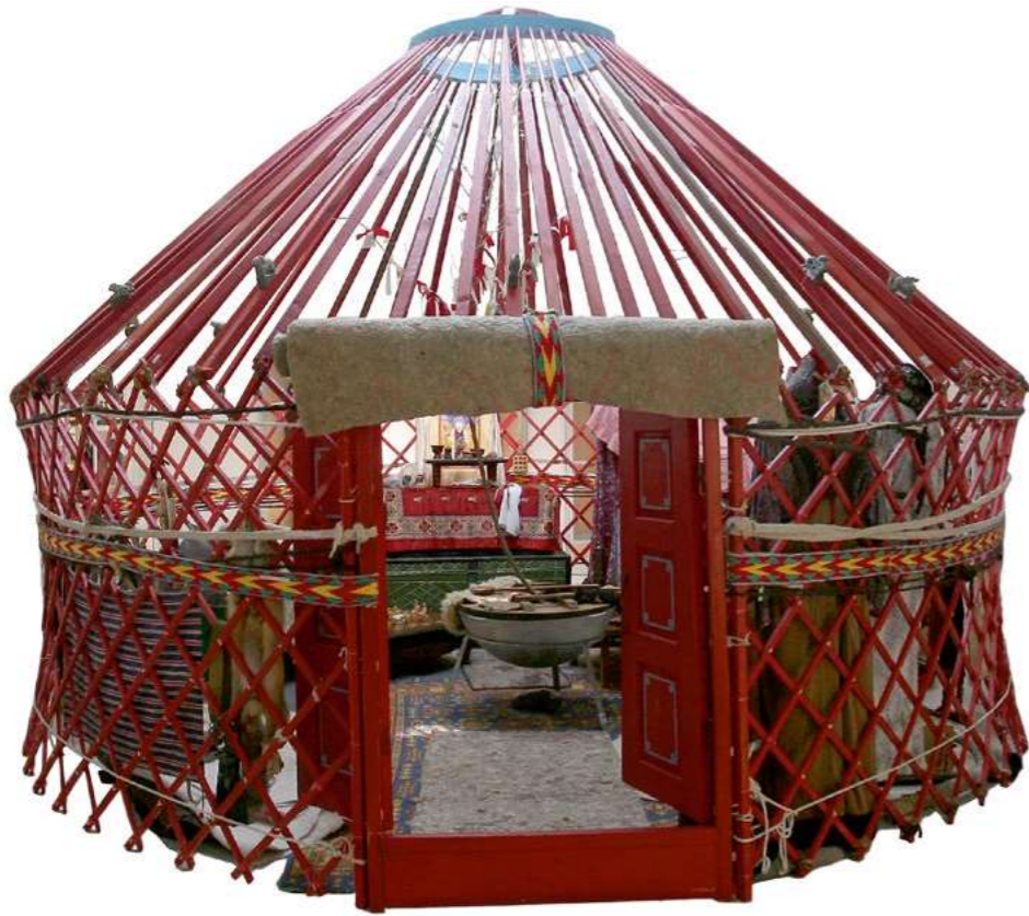
Ил. 2. Калмыцкая кибитка ишкэ гер . Музей калмыцкой традиционной культуры им. Зая-пандиты (МКТК) КалмНЦ РАН. Реконструкция 2014 г.

В энциклопедии «Монгол гэр. Тайлбар толь» исследователи Б. Баатархуу и Д. Одсүрэн разместили в формате словаря обширный материал, посвященный юрте. Он разделен на рубрики, в которые входят сведения о жилищах этнических групп Монголии, в том числе ойратов, проживающих на западной окраине страны. В начале XVII века часть ойратов ушла в прикаспийские степи России – так началось формирование калмыцкого народа, его культуры. В разделе «Халимаг гэр» 9 утверждается, что жилище калмыков, его пространственная структура продолжают традицию западно-монгольской юрты 10 .