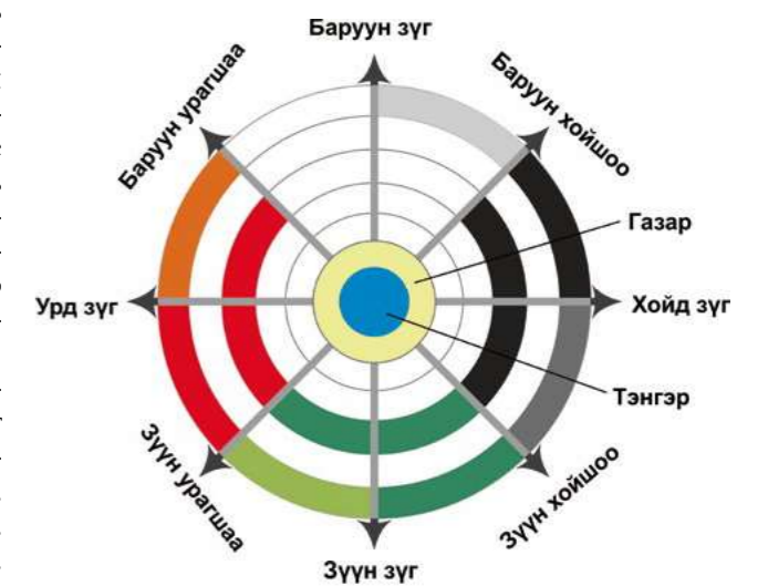
Ил. 1. Десять направлений: цветовая схема

Эволюция типов жилья кочевников Евразии подробно исследована отечественными учеными 6 . Деревянные конструкции: решетчатые стены, двери, дымоход, жерди и другие части «походного дома» – соответствуют необходимости постоянно транспортировать жилище. Шалашеобразное строение хатгуур гэр , до сих пор используемое ойратами Монголии при дальних перекочевках, представляет собой облегченный тип войлочного жилища без образующих стены деревянных решеток. Легкое в конструкции, оно соответствует мобильному образу жизни, подразумевающему постоянные перемещения – в теплое время года на летние становища, в холодное – на зимние 7 . Покрытие шкурами животных (вместо войлока) делает их еще более удобными при сборке, разборке и транспортировке. Строения такого рода использовались в походном быту пастухов, перегонявших скот на дальние расстояния. Они напоминают охотничий шалаш ( жолм у калмыков) из связанных сверху покрытых кошмой деревянных жердей 8 и представляют собой различные варианты целесообразно устроенного жилого пространства, укрывающего от непогоды. Вокруг него на территории временной животноводческой стоянки устанавливался защищенный от ветра загон для скота.