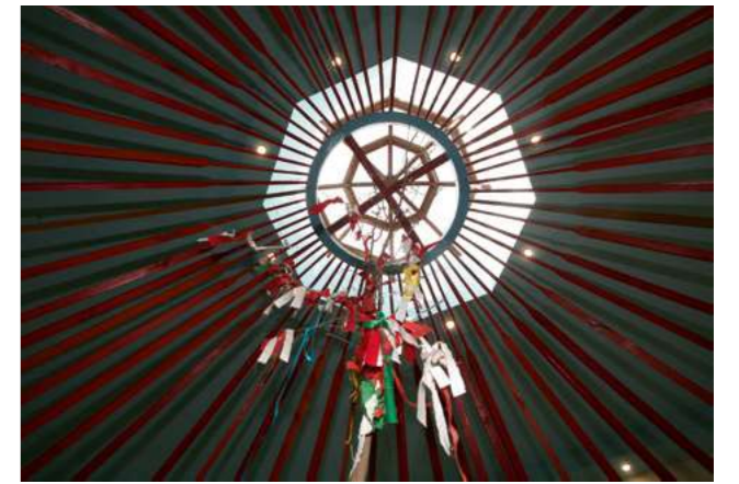
Ил. 5. Өрк – верхнее отверстие в конструкции кибитки ишкэ гер . Музей калмыцкой традиционной культуры им. Зая-пандиты (МКТК) КалмНЦ РАН. Реконструкция 2014 г.

Ярусное деление пространства калмыцкой кибитки, ее сферического объема