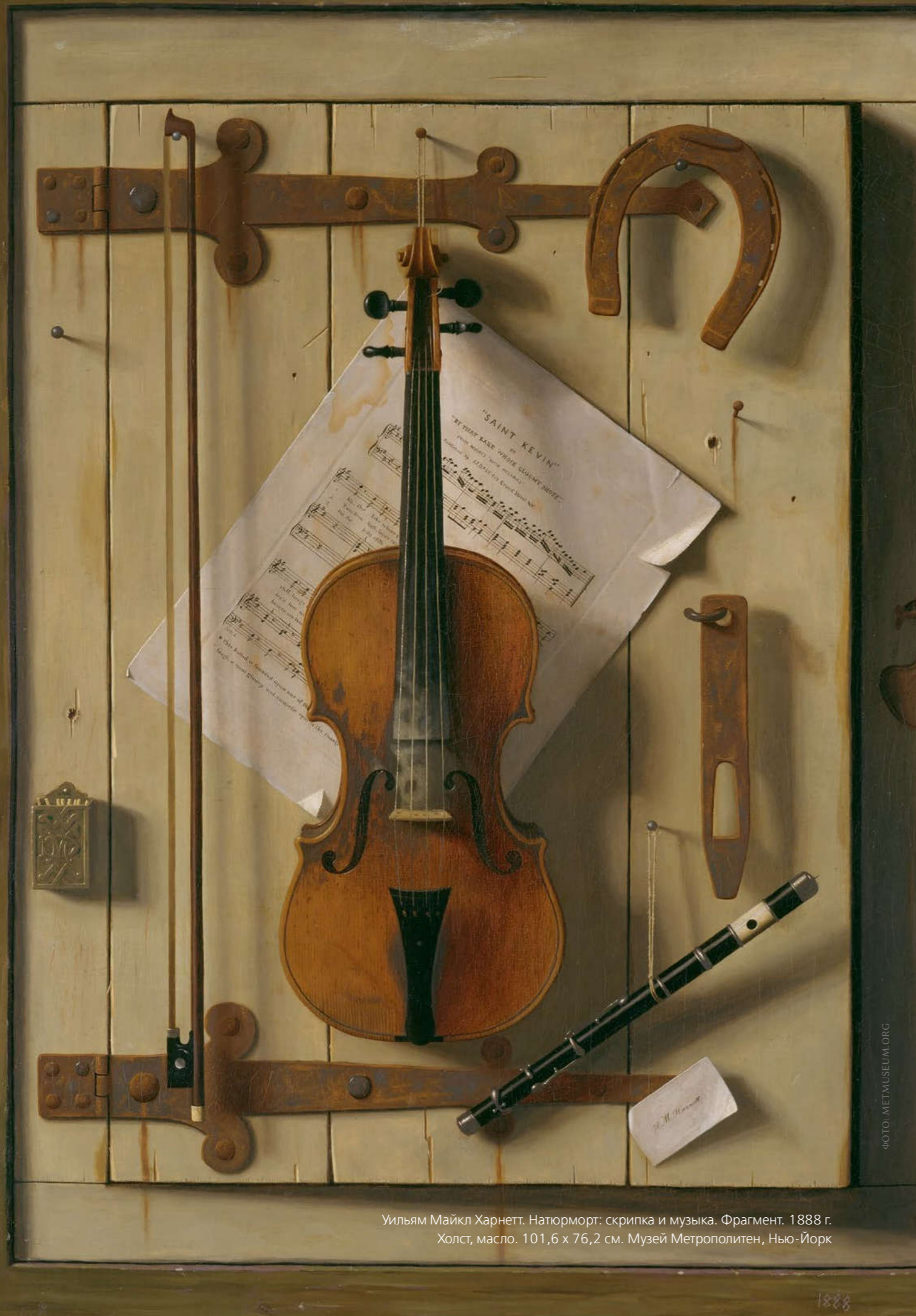
Уильям Майкл Харнетт. Натюрморт: скрипка и музыка. Фрагмент. 1888 г. Холст, масло. 101,6 x 76,2 см. Музей Метрополитен, Нью-Йорк